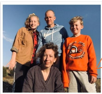
Familie Geerling uit Arnhem

Klik op de foto's om de volledige ervaring te lezen!